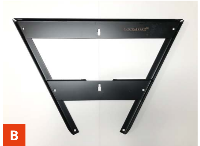
B Læg metalvangerne ud med de brede liggende øverst.