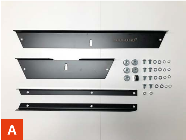
A BK-102 indhold.