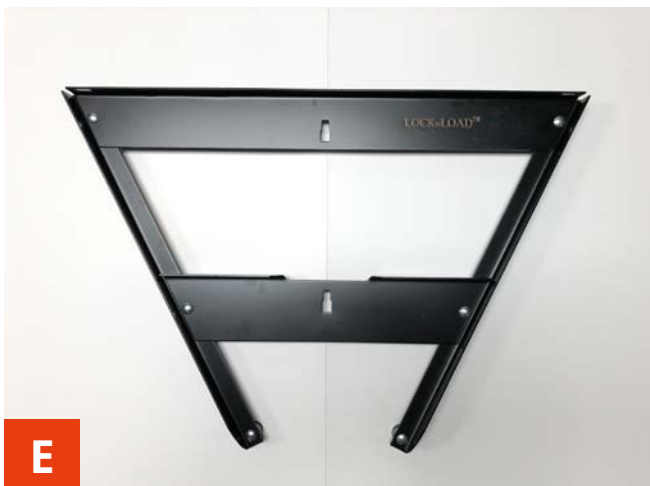
E Garage stativet samlet.