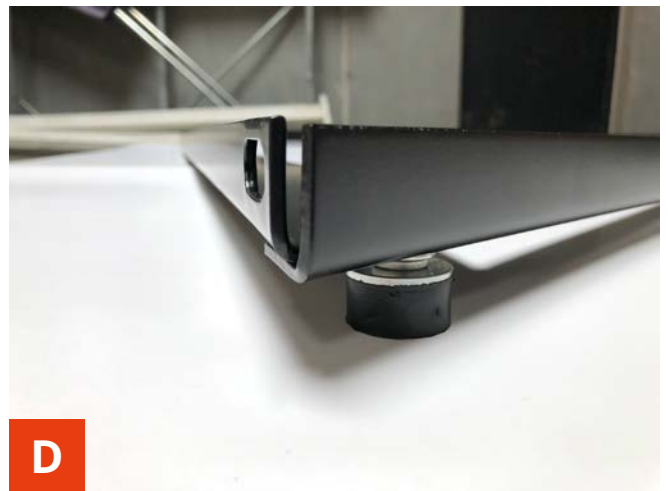
D Sæt skive, spændeskive og gummifod fast på bolten. Stram gummifoden fast så spændeskiven er helt samlet.