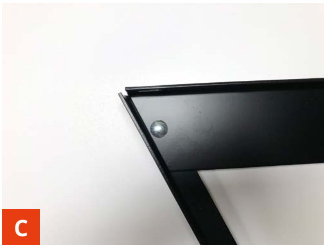
C Bolt korrekt monteret i det ene hjørne.